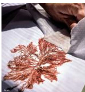
Fig. 32 : algue rouge (spécimen sec), Muséum national d'Histoire naturelle

Le Muséum est une institution culturelle, un centre de recherche et d'apprentissage : de ses chemins familiers à ses coulisses les plus secrètes, le lecteur est ainsi emporté dans une traversée au cœur d'un des trois plus grands muséums d'histoire naturelle du monde.