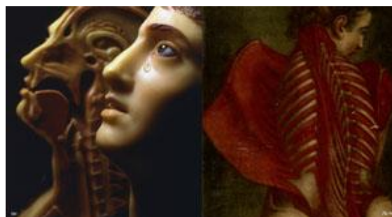
Fig. 64 : La Femme à la larme par André Pierre Pinson (cire anatomique), Musée de l'Homme