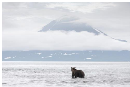
Image 1 : Femelle d'ours brun et ses petits, Kamtchatka (Russie), 2006