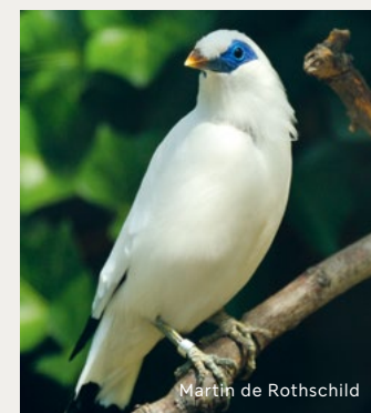
Martin de Rothschild

Il a été découvert en 1911 sur l'île de Bali (en Indonésie) dans un territoire ne dépassant pas 40 km 2 . C'est l'un des oiseaux les plus rares et les plus menacés, il est aujourd'hui pratiquement éteint dans la nature.