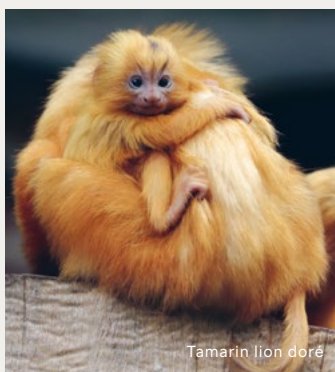
Tamarin lion doré

Il vit sur une centaine de km 2 dans la forêt primaire du Brésil. C'est l'une des forêts tropicales les plus menacées au monde : il ne subsiste que 8 % de sa surface d'origine. Ce tamarin ne doit sa survie qu'à la mise en place de programmes de réintroduction.