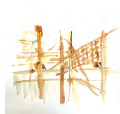
La cage des singes

2) « J'aime me promener dans le jardin des plantes quand tout est encore tranquille, le matin, pour dessiner les animaux que je découvre : surtout les flamants roses, les serpents, et les gours, des sortes de taureaux énormes ». Voilà !