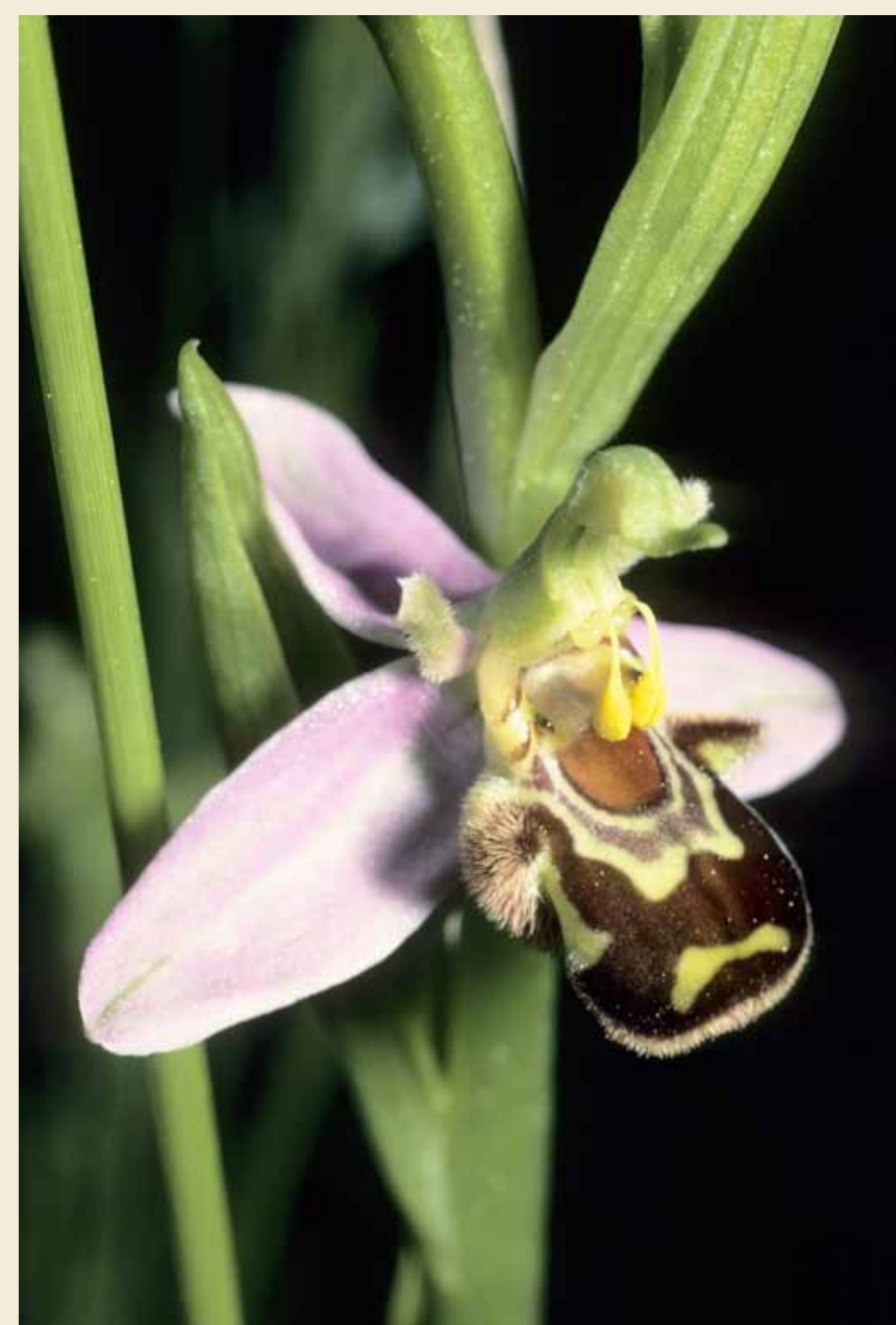
Ophrys abeille, Ophrys apifera