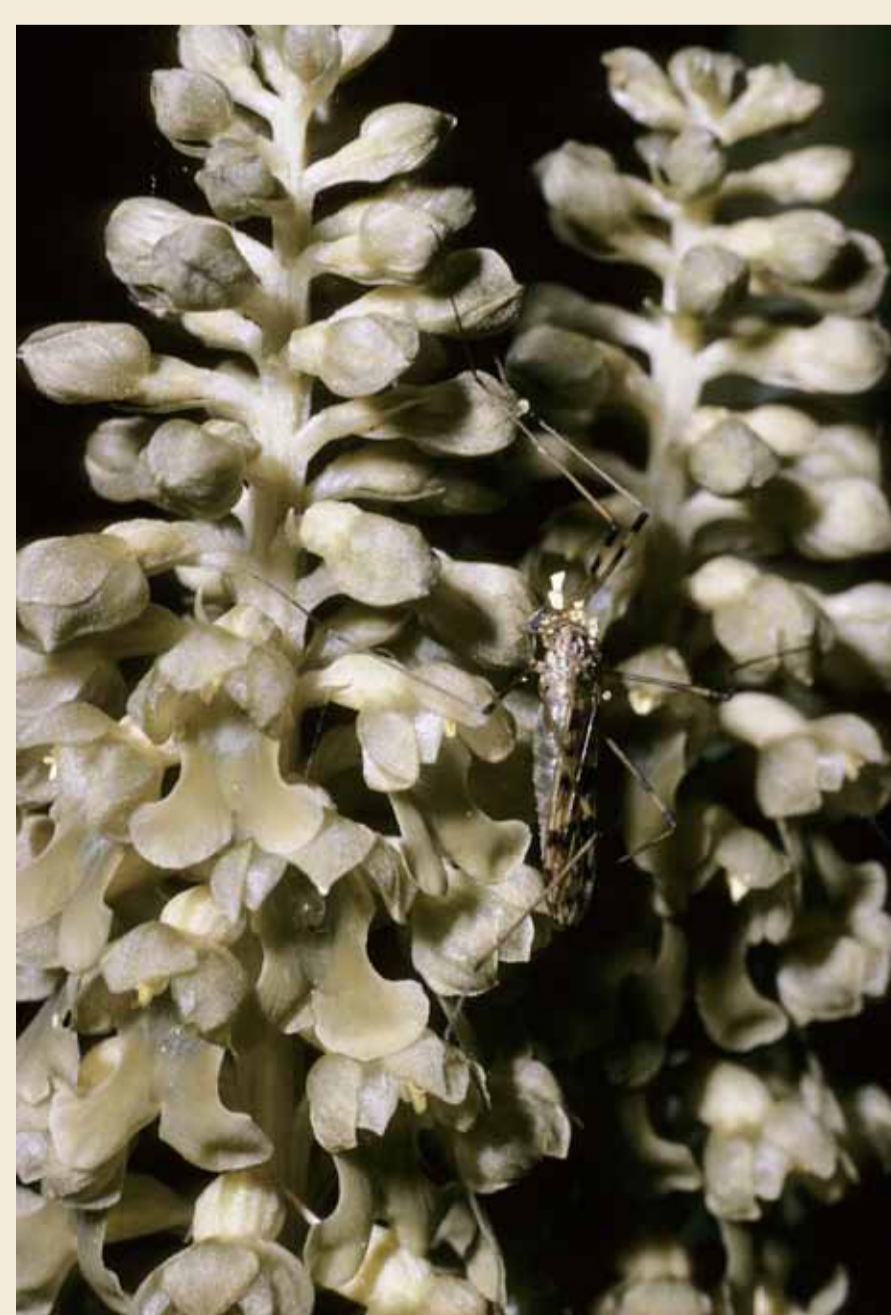
Néottie nid d'oiseau, Neottia nidus-avis