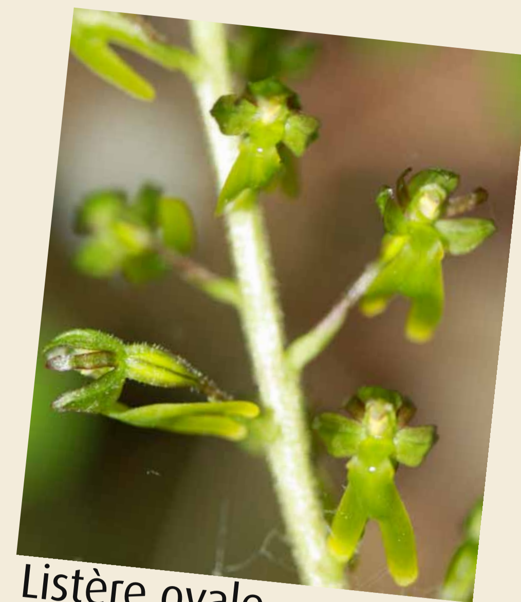
Listère ovale, Listera ovata