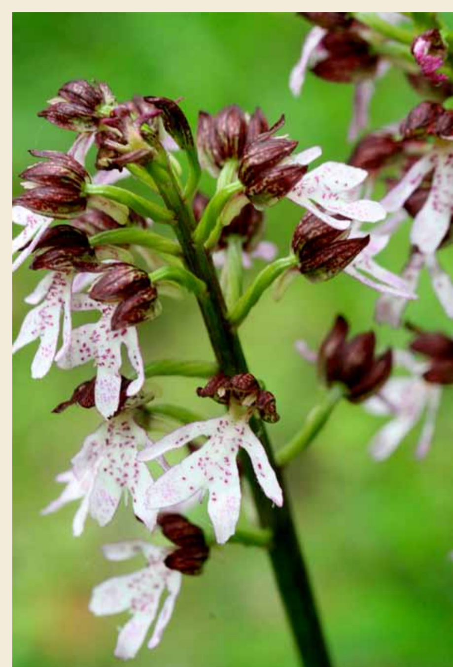
Orchis pourpre, Orchis purpurea