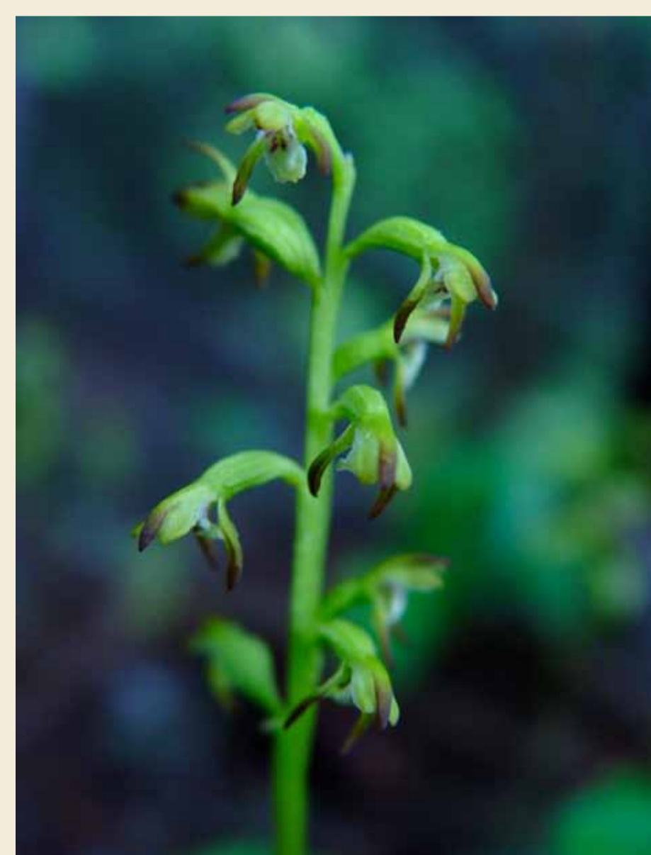
Racine de corail, Corallorhiza trifida