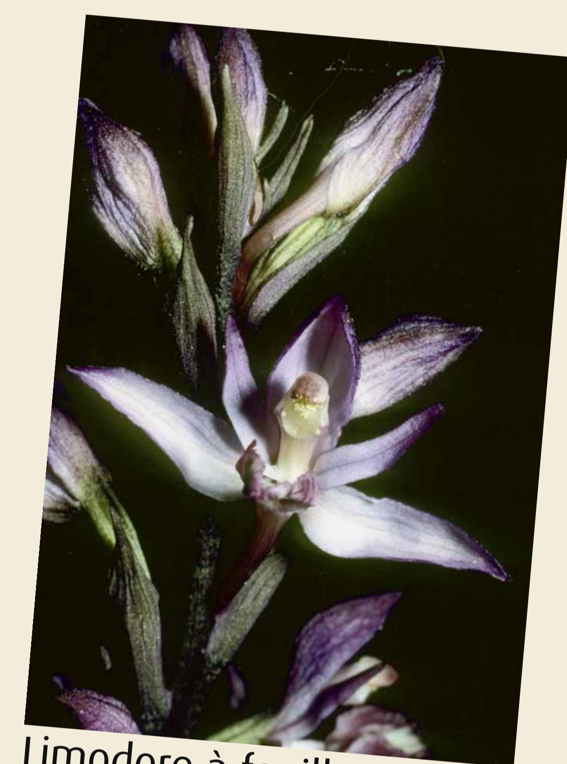
Limodore à feuilles avortées, Limodorum abortivum

Plus de 1000 espèces, la plupart épiphytes, se répartissent sur les îles françaises tropicales (Réunion, Guadeloupe, Mayotte, Tahiti...) et dans l'immense Guyane, essentiellement dans les forêts denses.