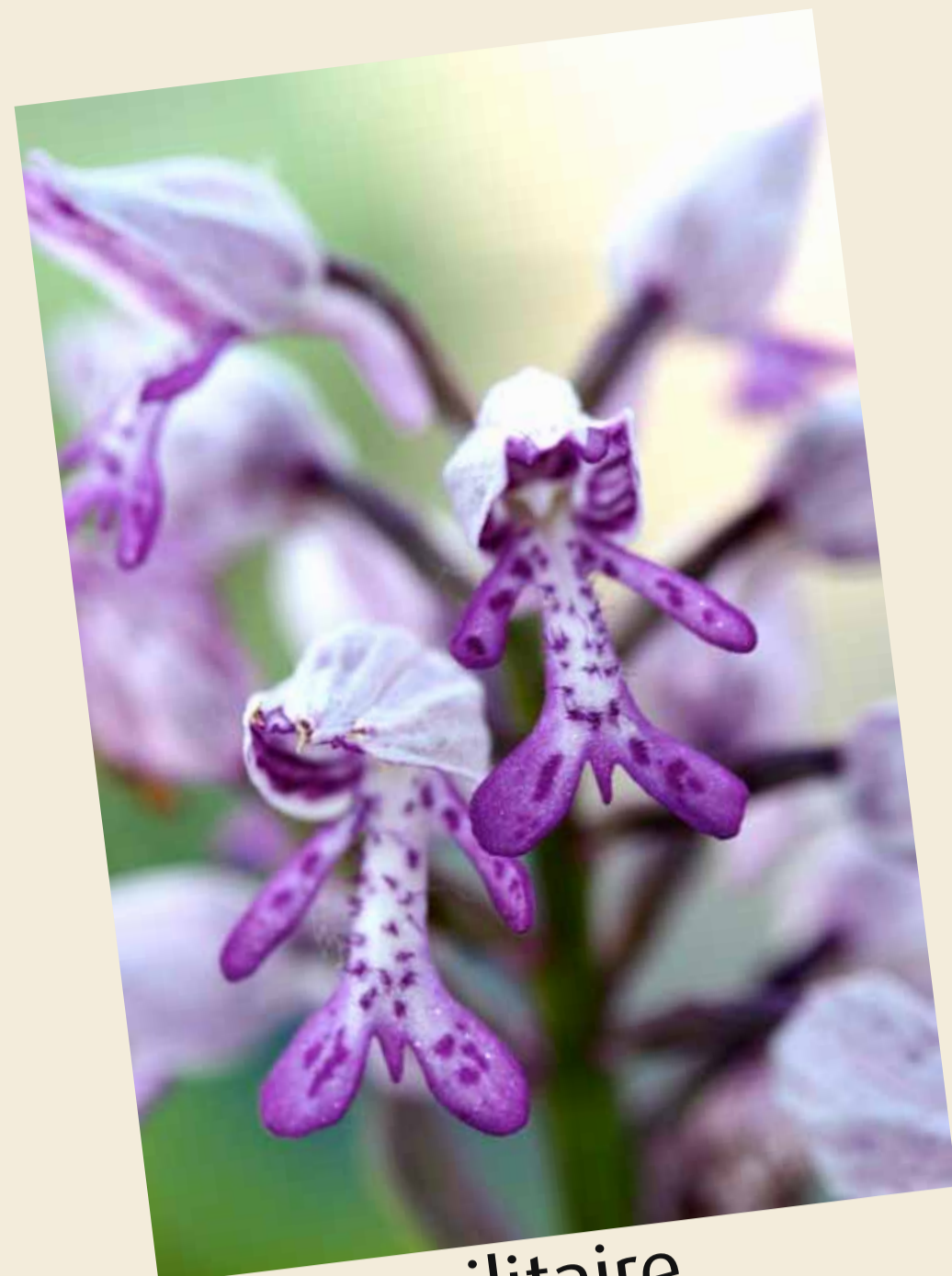
Orchis militaire, Orchis militaris ©M. Telepova