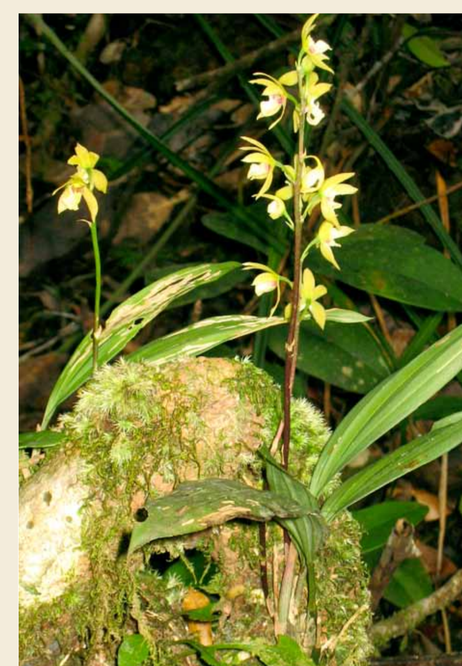
Koellensteinia carraoensis (Guyane)