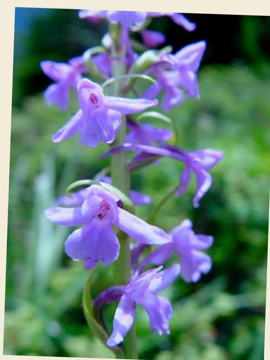
Orchis moucheron, Gymnadenia conopsea