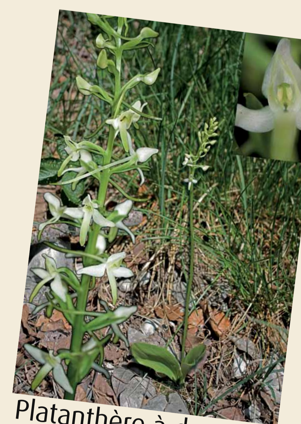
Platanthère à deux feuilles, Platanthera bifolia