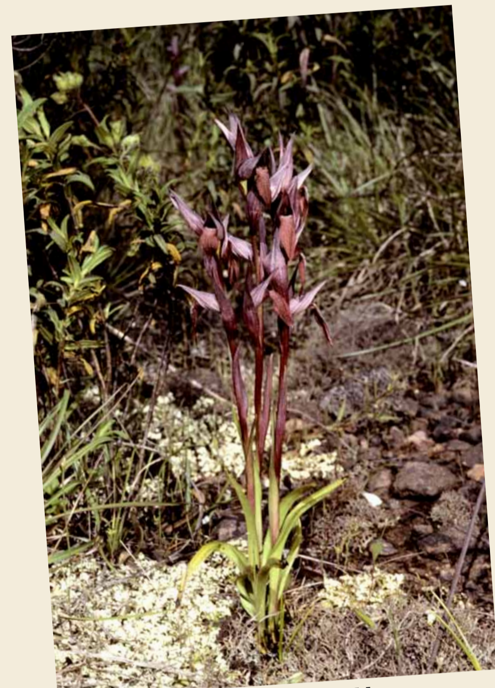
Sérapias à labelle allongé, Serapias vomeracea