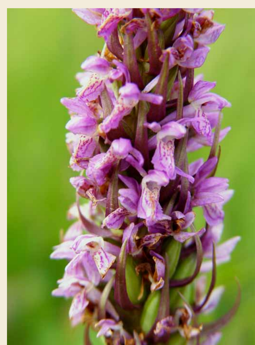
Orchis incarnat, Dactylorhiza incarnata