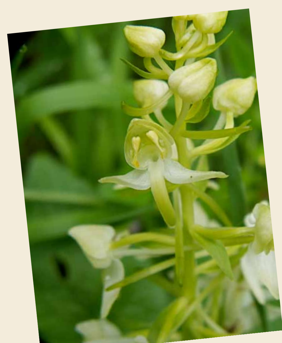
Platanthère verte, Platanthera chlorantha

Ne cueillez pas, n'arrachez pas les orchidées ! Mais admirez, sentez, photographiez, dessinez-les si vous voulez.