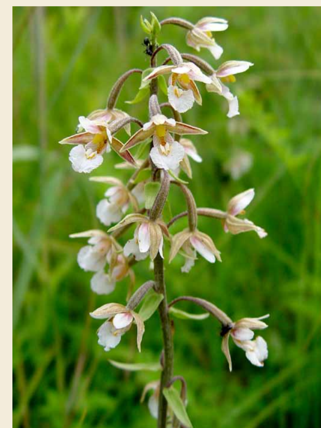
Epipactis des marais, Epipactis palustris