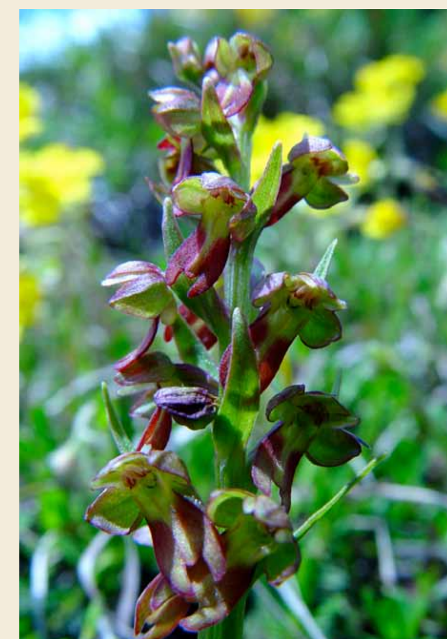
Orchis grenouille, Coeloglossum viride