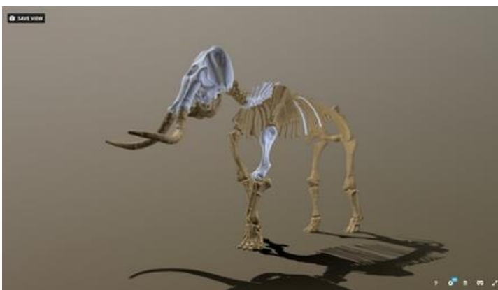
Mammoth vue 3D

Retrouvez cette modélisation sur mnhn.fr/mammoth