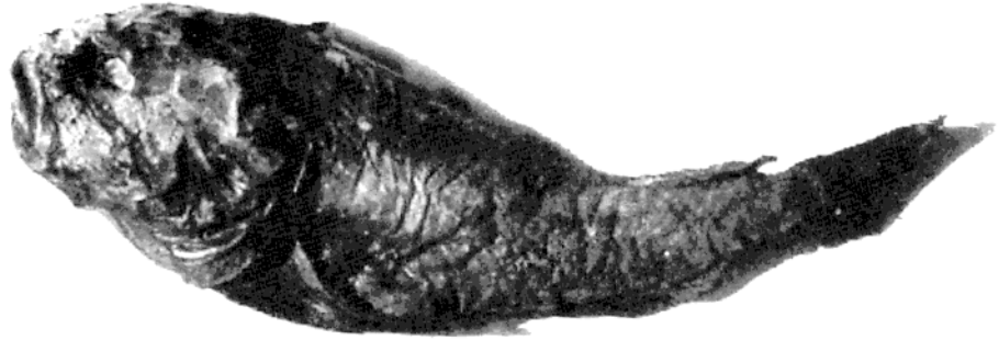
Fig. 1. Photographie de l'exemplaire d' Ebinania costaecanariae (MMC/1V2000). [Photography of the specimen of Ebinania costaecanariae .]

Méditerranée" (Fedorov et Nelson, 1986). L'aire de distribution connue s'étend du Cap Blanc (Mauritanie) (Nelson, 1990) à la Namibie (Nelson, 1986) entre 300 et 700 m de profondeur. C'est la première fois que cette espèce est signalée dans l'Atlantique nord-est. De plus, c'est une observation supplémentaire d'espèces à affinités tropicales capturées depuis 1960 dans l'Atlantique européen (Quéro et al. , 1997, 1998).