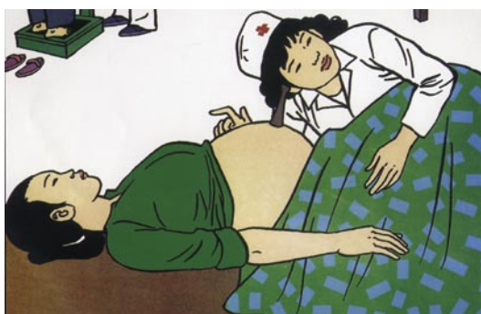
De l'usage du stéthoscope pendant le suivi de la grossesse « Les femmes enceintes doivent se faire examiner par un médecin au moins cinq fois pendant la grossesse .... » in « Améliorer la connaissance des soins à l'accouchée et au nouveau-né. Projet de développement pour le district de Chi Linh, World Vision », Vietnam, 2004. Vo Thi Thuong / Musée d'Ethnographie du Vietnam