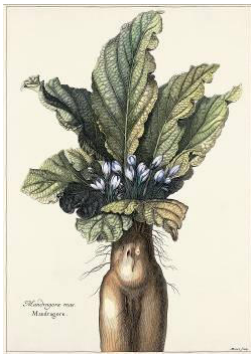
10. Mandragora mas. Mandragore Abraham Bosse (1602-1676) Eau-forte et burin, aquarellé à la main Tirage moderne de la Chalcographie du Louvre, 2008