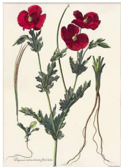
12. Papaver corniculatum, flore luteo. Coquelicot Nicolas Robert (1614-1685) Gravé d'après Nicolas Robert Eau-forte et burin, aquarellé à la main Tirage moderne de la Chalcographie du Louvre, 2008