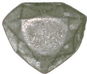
Modèle en plomb ou « plomb » du « diamant bleu de la Couronne » retrouvé dans des fonds anciens en cours d'inventaire au MNHN de Paris. Dimensions : 30,4 x 25,5 x 12,9 mm.

La découverte récente d'une réplique historique en plomb du mytheique diamant bleu, dans les collections du Muséum national d'Histoire naturelle, a permis la réédition exacte en réalité virtuelle puis en zircone (matériau imitant le diamant) de ce joyau royal, volé à la France en 1792. Les résultats de ces travaux, menés par François Farges 1 , chercheur au Département Histoire de la Terre du Muséum, sont publiés dans le volume 165 de la Revue de Gemmologie .